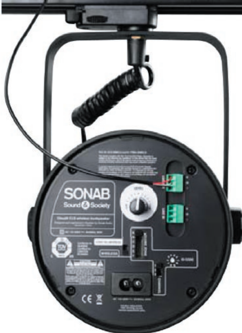
Odbiór bezprzewodowy, kabel do następnego głośnika (kabel symetryczny)