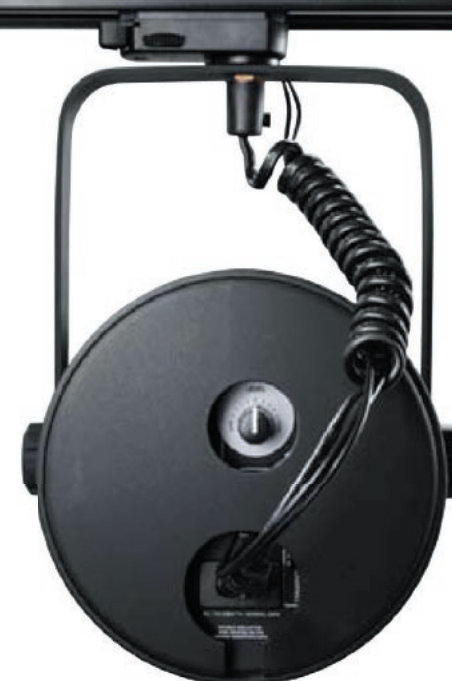
Z pokrywą przeciwkurzową