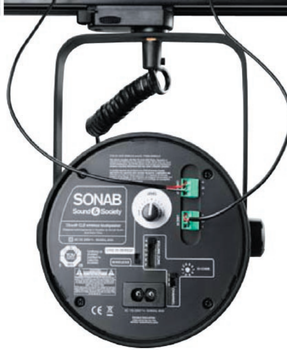
Odbiór kablowy, kabel do następnego głośnika (kabel symetryczny)