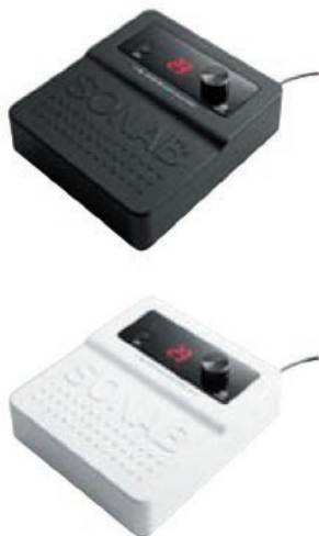
Bezprzewodowa regulacja głośności CVM