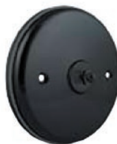
Uchwyt ścienny CWB na głośnik CLS (opcjonalny)