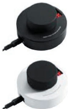
Rozszerzenie głównej regulacji głośności CVX (opcjonalny)